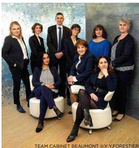
TEAM CABINET BEAUMONT