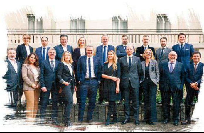
Simon Associés, une équipe réunie autour de valeurs communes*

J.-C. et F.-L. S. : Oui, car nous sommes depuis longtemps acteurs de la transformation numérique de la profession. Nous avons développé nous-mêmes des outils tels que Mission RGPD, pour la gestion des données nominatives, LCM (Legal Client Management) et SimonAcademy, offrant une doctrine toujours à jour. Notre prochain projet est une plateforme qui mettra en relation les avocats indépendants avec leurs clients, une solution originale, jamais rencontrée. Ce travail est aussi pour nous le moyen de garantir la relation fluide, transparente et efficace qui est l'empreinte que nous portons ■